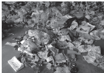
Takto vyzerá náš vyseparovaný odpad na zbernom dvore.

predmet, ktorý tam nepatrí, musia celú várku pracne pretriediť. Možno si povieť: „To by som nikdy nechcel robiť“. Áno, je to neprijemná práca, nečistá, nevoňavá. Tak to teda svojim nedôsledným separovaním nenúťme robiť iných. Stačí pritom tak málo. Riadiť sa pokynmi na nálepke na kuka nádobe a ostatný odpad správne vytriediť. A potom pôjde všetko ako po masle, odpad budeme mať správne pripravený pre odberateľa, nebude nám ho vracat' na pretriedenie, na zbernom dvore bude čisto a poriadok. Ja si to viem predstaviť. A čo vy?