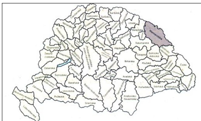
Poloha župy v Uhorsku