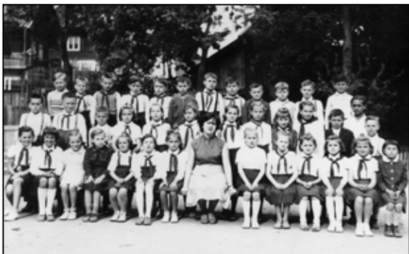
Tretiaci B triedy na dvore starej školy