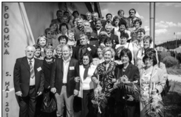
Po rokoch na stretnutí